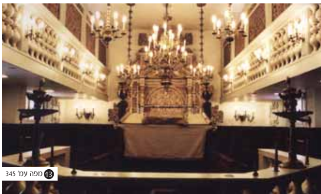
בית הכנסת האיטלקי - בית הכנסת מקונליאנו ונטו (משנת 1704) שהועבר בשלמותו לירושלים בשנת 1952, מבט מבפנים.

"נעשיתי קובר מתים בירושלם, כי לא ימצא בה נושאים מתים והולכי אחר המטה. וכבר היה מעשה באשה אחת שמתה' ובחצי הדרך הוכרחנו לקרוא לנשים שתבאנה ותשאנה, כי לא היה עמנו איש. ולולי נשים רבות הצובאות ללכת אחרי המטה וקצת בעלי תשובה אשר מזרע האנוסים המה, היה המת מוטל, שאין לו קוברים, כי אנשי הארץ עצמה לא יחמלו ולא ירחמו".