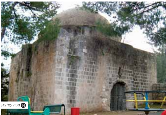
14 ספה עמ' 345

קורותיו של רבינו עובדיה ומצב העיר מתועדות בשלש אגרות אותן הוא כותב בשלש השנים הראשונות לעליתו לאביו לאחיו ולבנקאי האישי שלו בפירנצה, וכן מאגרת תלמיד הבא מאיטליה ללמוד בישיבתו בירושלים.