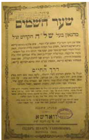
שער השער - שער סידור התפילה שער השמים אותו כתב השל"ה הקדוש, על פי כוונת המקובלים.

אחר שנפדו בסכום כסף גבוה ברח השל"ה לצפת בה התגורר כ-3 שנים, סיים את ספרו הגדול ושלחו לבניו לפראג. בספרו מתנגד השל"ה לשיטת הלימוד בפילפול אשר רווחה ברוב ישיבות פולין וליטא וקורא ללימוד על דרך הפשט לשם בקיאות וברור ההלכה למעשה. את הנערים קורא הוא ללמד את ספרי הנביאים ואת יסודות השפה העברית לפני כניסתם לעולם התלמוד. בנוסף לחיבורו הגדול חיבר השל"ה ספרים נוספים שהמרכזי שבהם הנו פרוש קבלי לסידור התפילה בשם 'שער השמים'. השל"ה נפטר בטבריה בשנת 1630 ונקבר בסמוך לקבר הרמב"ם.