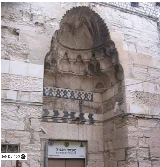
18 ספה עמ' 360

לאחר 6 שנים בעיר מולדתו נפטרת עליו אשתו ור' ישעיהו מחליט לשים פעמיו לארץ ישראל מתוך רצון לסיים בה את חייו וגדול מפעליו - ספר 'שני לוחות הברית' אותו כותב הוא כצוואה רוחנית לצאצאיו. ר' ישעיהו יוצא למסע ארוך ורב תלאות לארץ הקדש בה שולטים העות'מאנים, אותו מתאר הוא לבניו באגרתו - "כבר כתבתי לכולכם כמה כתבים כי היה ה' אתנו בים וביבשה. אין שטן ואין פגע רע תודה לאל, רק השגחה פרטית מאת ה' יתברך ברוך הוא, לא חסרנו דבר... גם בים הייתי מרוחם בעיני שר הספינה לאדון ופטרונו, והיה לנו בית דירה חשובה לתורה ולתפילה... ובאתי בראש השנה לטרבולא (עיר חוף בצפון לבנון)... וה' עשה לנו נס שבא עכוב