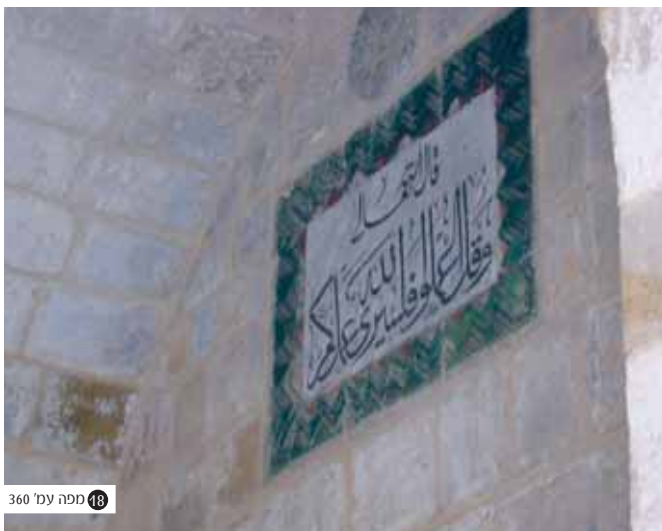
18 ספה עמ' 360

ימי שלותו בירושלים לא ארכו, ובשנה השלישית לעליתו באו על הישוב היהודי בעיר הימים השחורים ביותר בכל חמש מאות שנות השלטון העות'מאני, ימי הפחה אבן פארוך. ימים אלו מתאר השל"ה בחריזה בספרו