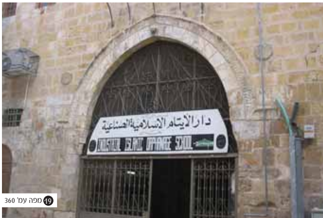
הטרייה - בית השלטון העות'מאני. מושב הפחה הטורקי השולט בעיר. מכאן נשלטו העיר ויהודיה בשלטון עריצים המסור לנחמות כל שליט מזדמן.

להספינה... כי אלו הלכנו שם היינו נשבים שם גוף וממון כי היתה שם מלחמה גדולה. בכך חזרנו לאחור וסיבבנו הדרך לסוריא ורדף אחרינו גליאה (אניה) עם בעלי מלחמות (שודדי ים) וה' הציל אותנו... שהוא שלח רוח חזק אחורי ספינתנו שנלך במרוצה, וספינה שלהם נתעכב, בכך באנו בשלום למדינת סוריא קודם יום כיפור."