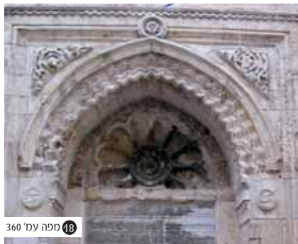
המחכמה - הסביל הממלכי בפתח המחכמה. המנצל ארון קבורה תיק (טרקופק) ככיוור לוחות עולי הרגל ותושבי העיר.

ר' ישעיהו, נצר למשפחת לוויים מפורסמת העוקרת בשנת 1391 מספרד לעיירה הורוויץ שבצ'כיה. משם מגיעים בניה לפראג מיסדים בה ישיבות ובתי כנסת ונושאים בתפקידי רבנות מרכזיים. ר' ישעיהו עצמו נולד אף הוא בעיר, מצטיין בלימודיו התורניים אצל אביו ונשלח מפראג ללמוד בישיבות גדולי הדור - המה"רם ור' יהושע פאלק בעל ספר 'מאירת עיניים' - בלובלין ובקרקוב שבפולין. כבר בצעירותו יצא טבעו בעולם ובגיל 30 שותף הוא לישיבת 'ועד 4 ארצות', מינהלתה הרוחנית - חברתית - כלכלית של יהדות מזרח אירופה. לאחר נשיאה בעול הגדולות והמפוארות ברבנויות פולין, ליטא, גליציה וגרמניה מגורש ר' ישעיהו עם קהילתו מפרנקפורט על נהר מיין (להבדיל מתאומתה פרנקפורט אשר על נהר האודר), חוזר לעיר מולדתו פראג ונושא בעול רבנותה. את חייו חי ר' ישעיהו ברוחה כלכלית עצומה כשהוא מחזיק תלמידי חכמים ושמונים מהם סועדים מדי יום על שולחנו בקביעות, כפי שמתאר בנו ר' שעפטיל: "ראת חטאו היתה קודמת לחכמתו... בלמוד התורה היה יורד ונוקב עד התהום בפלפולא חריפתא... ותפס ישיבות רבות לשם ולתפארת... ומכח שבילדותו זכה למעלות גדולות שנתקבל לאב בית דין ומורה צדק בקהילות גדולות וגלילות, ויט שכמו לסבול סבל משא העם הזה כרועה צאנו לנהל על מי מנוחות במילי דשמיא ובמילי דעלמא... נלא די שהיה רעיא מהימנא לבית ישראל בתורתו ובעבודתו, אף תרב מעלתו וחסידותו, כי החזיק ידי לומדי תורה ומימיו לא פסקו