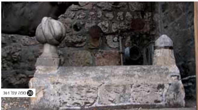
קברי המהנדסים - הטורבן שבראש המצבה מורה על מעמדו ומקצועו של הקבור תחתיו. על פי השמועה למדנו כי כאן נטמנו אחר כבוד מהנדסיה הרשנים של חומת העיר.

הגדול - "אין יובל בלא הרבות אבל, אין שמיטה בלא ירידה מטה מטה, אין שנה בלא ראש ולענה, אין תקופה בלא מכה ואין תרופה ... אין יום בלא רתת ואיום, אין לילה בלא יללה, אין שעה בלא רעה, אין רגע בלי פגע, כל הצלחה לצוחה, וכל שמחה לאנחה, כל מילה ליללה, כל מעלה לשפלה, כל שאון לסאון".