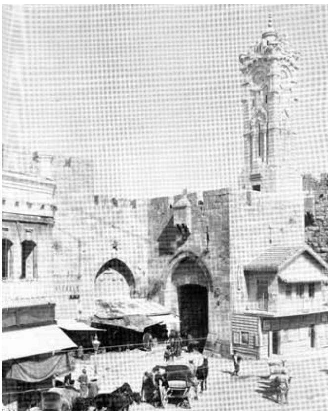
שער יפו - המרכזי בשערי ירושלים. ממנו יוצאת הדרך לעיר הנמל הגדולה יפו. והדרך חבונה, באב אל ח'ליל. מגדל השעון שהתנוסס מעל השער לכבוד השולטן הטורקי כבר הספיק להתמוטט, שלא כחבריו היפואי, החיפאי, הכוכאי והשכמי.

מהקהילה הירושלמית הקטנה והעניה את סכנת ההשמדה באשמת מרידה משיחית בשלטון העות'מאני. וכעדותו - "גם אני אומר תהילות לאל... שבהיותי יושב בכבוד מעלה... בעיר הגדולה לאלוקים... יע"א נתן בלבי לצאת לשם על מנת לבא פה ירושלים תכונן ותבנה במהרה בימינו. וברחמי הרבים זכני לעלות אליה ולהסתופף בחצרותיה עם ביתי (משפחתי) היום 14 שנה ועוד הפליא חסדו לי ברחמי וזכני לזכות את הרבים... בזמן בשורות השוטים, דוברי שקרים תפח רוחם. כי לולא שנמצאתי אז בעיר הקדושה הזאת תכונן ותבנה במהרה בימינו ובמתק שפתים הייתי מיישב דעתם ומדבר על לבם, כבר היתה חרבה אז מכל היהודים עד בלי השאיר אפילו מנין כמפורסם לכל היושבים בה".