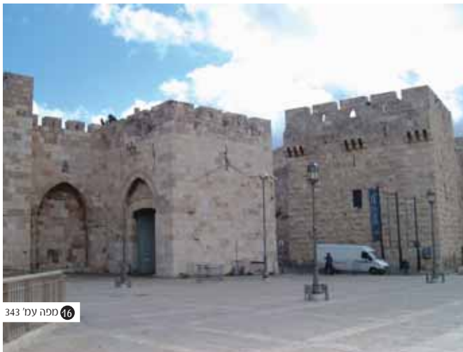
16 מפה עמ' 343

שער יפו כיום - ולצידו מעבר הרכב אשר פרוצו הטורקים בחומה, כחלק ממחוזות ההתרפסות לרגל ביקור הקיסר הגרמני וילהלם השני (1898).