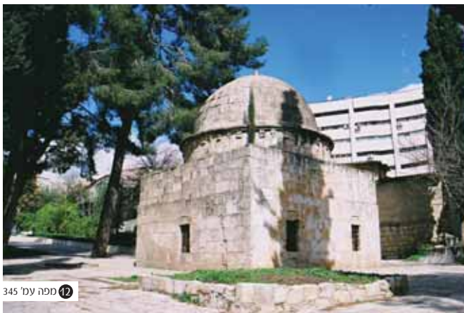
12 מפנה עמ' 345

כעבור ימים אחדים תצליח החבורה בניסיון החפתה השני, תגיע ליבשה ותצדע 18 מיל עד העיר אלכסנדריה. באלכסנדריה מצטרף רבינו עובדיה ליהודי "אשר נדר ללכת לחוג את חג המצות בירושלים עם אשתו ושני בניו" ויחדיו הולכים הם לקהיר ומצטרפים לשירת גמלים החוצה את מדבר סיני בואכה עזה. מעזה ממשיכה החבורה דרך חברון ובית לחם והנה עומדות רגליה בשערין ירושלים הממלוכית, בצהרי יום י"ג ניסן שנתים וארבעה חודשים וחצי מיום יציאת רבינו עובדיה לדרכו - "ובאנו עד שערי ירושלים ונכנסנו בה בשלושה עשר לחודש ניסן רמ"ח בצהרים. בעצם היום ההוא עומדות היו רגלינו בשערין ירושלים. ושם בא לקראתנו רב אשכנזי אחד, אשר נתגדל באיטליה שמו רבי יעקב דיקולומבאנו, והביאני אל ביתו, ונתאכסנתי עמו כל ימי הפסח".