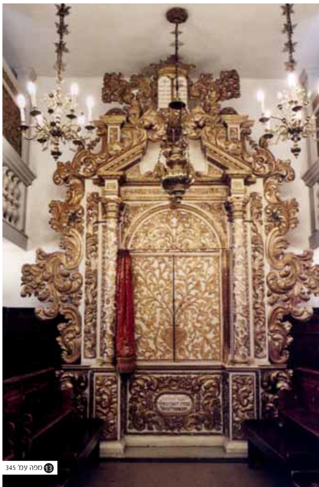
345 עמ' 3