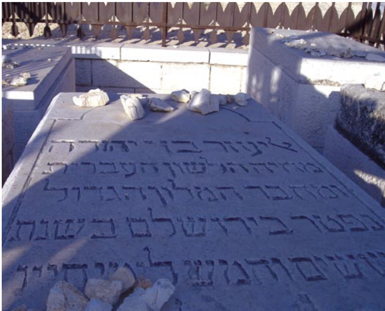
המחזיר נשמות לפגרים מתים • קבר מחיה השפה • נעם פרל