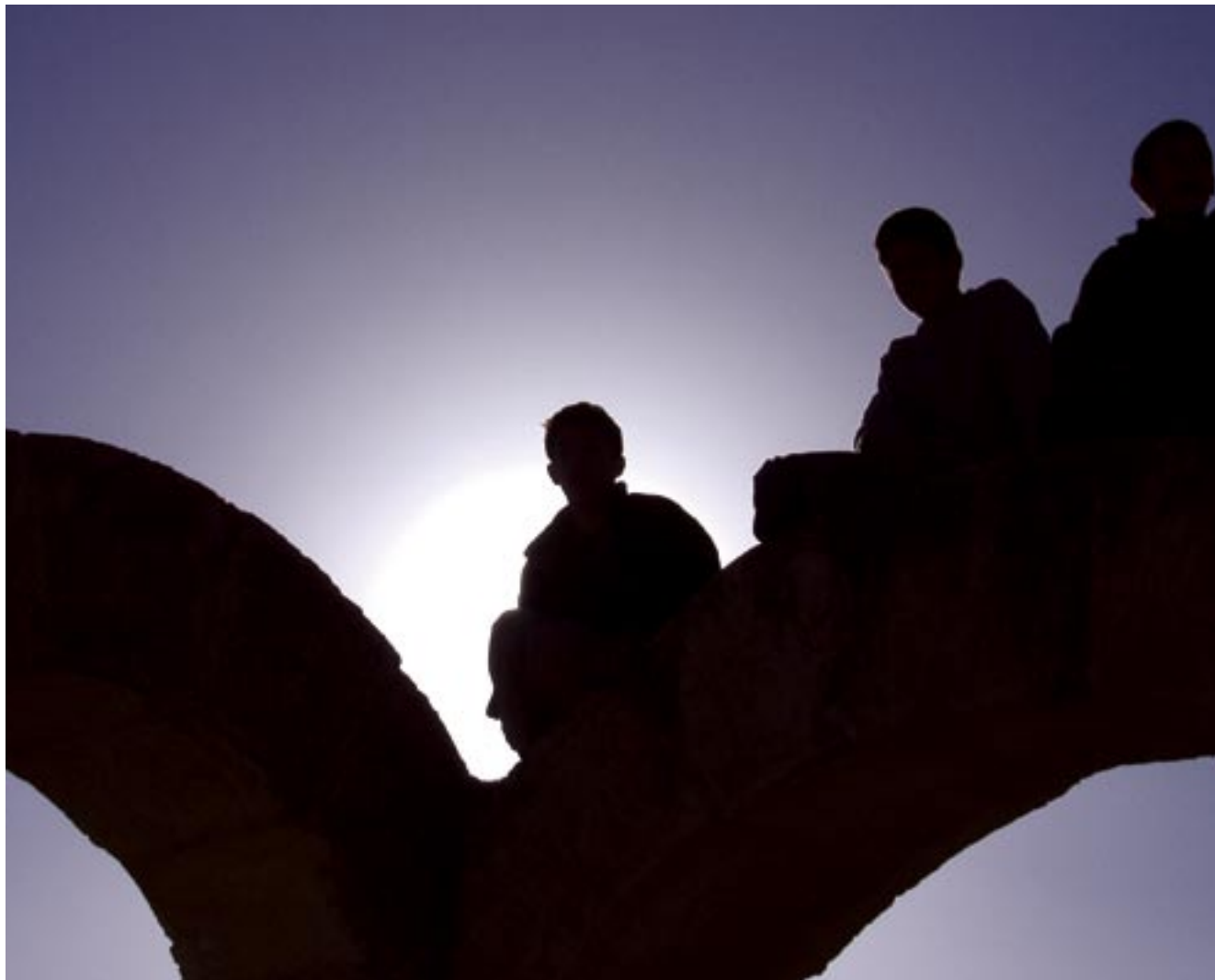
דבֿה אִמוֹנֶדֶךְ • אֶתֶר סוֹסֵיא • אֶרְוֹן בֶּרֶךְ / מַחְזוֹר ח