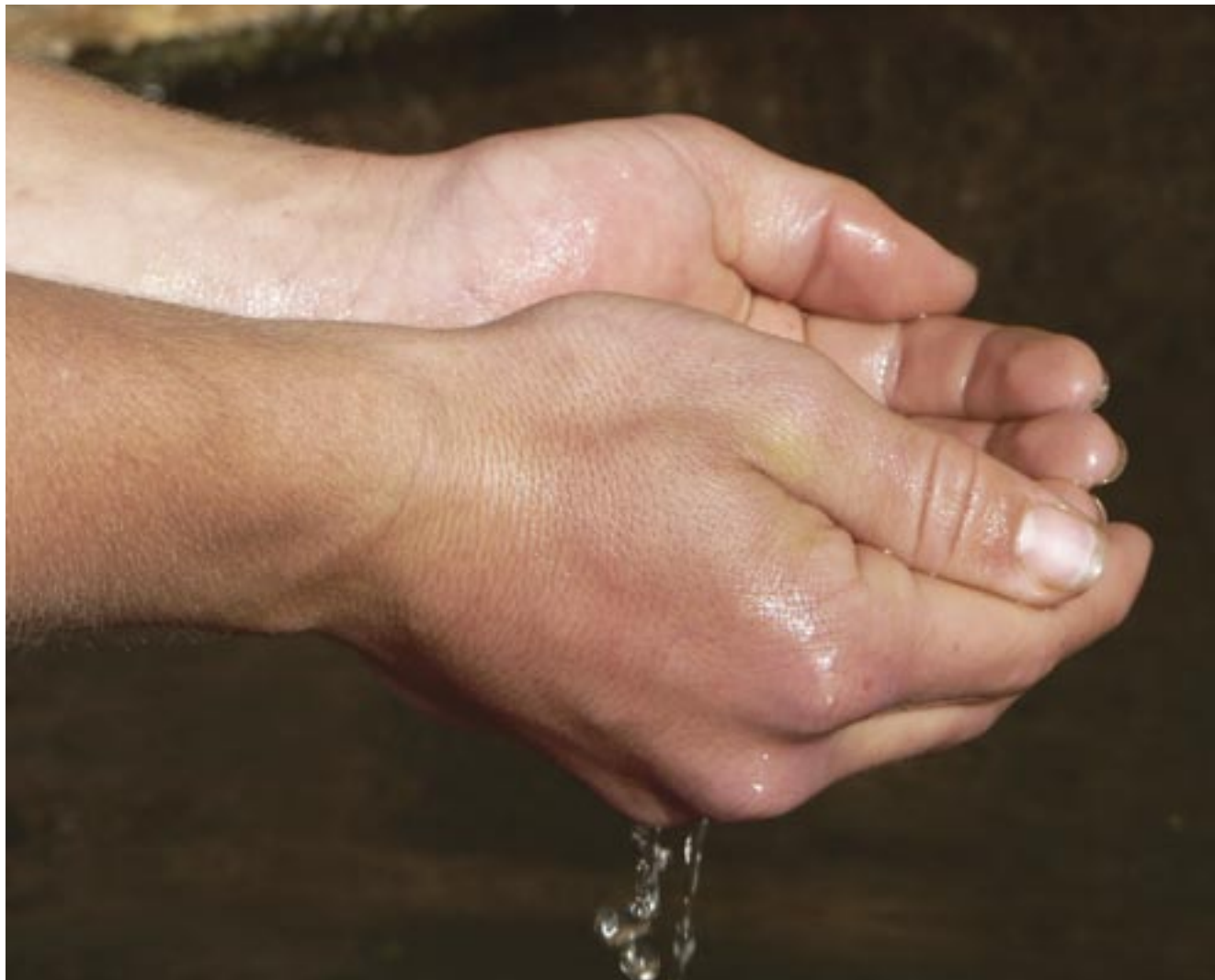
על נטילת ידיים • עזן הופמן / מחזור ז