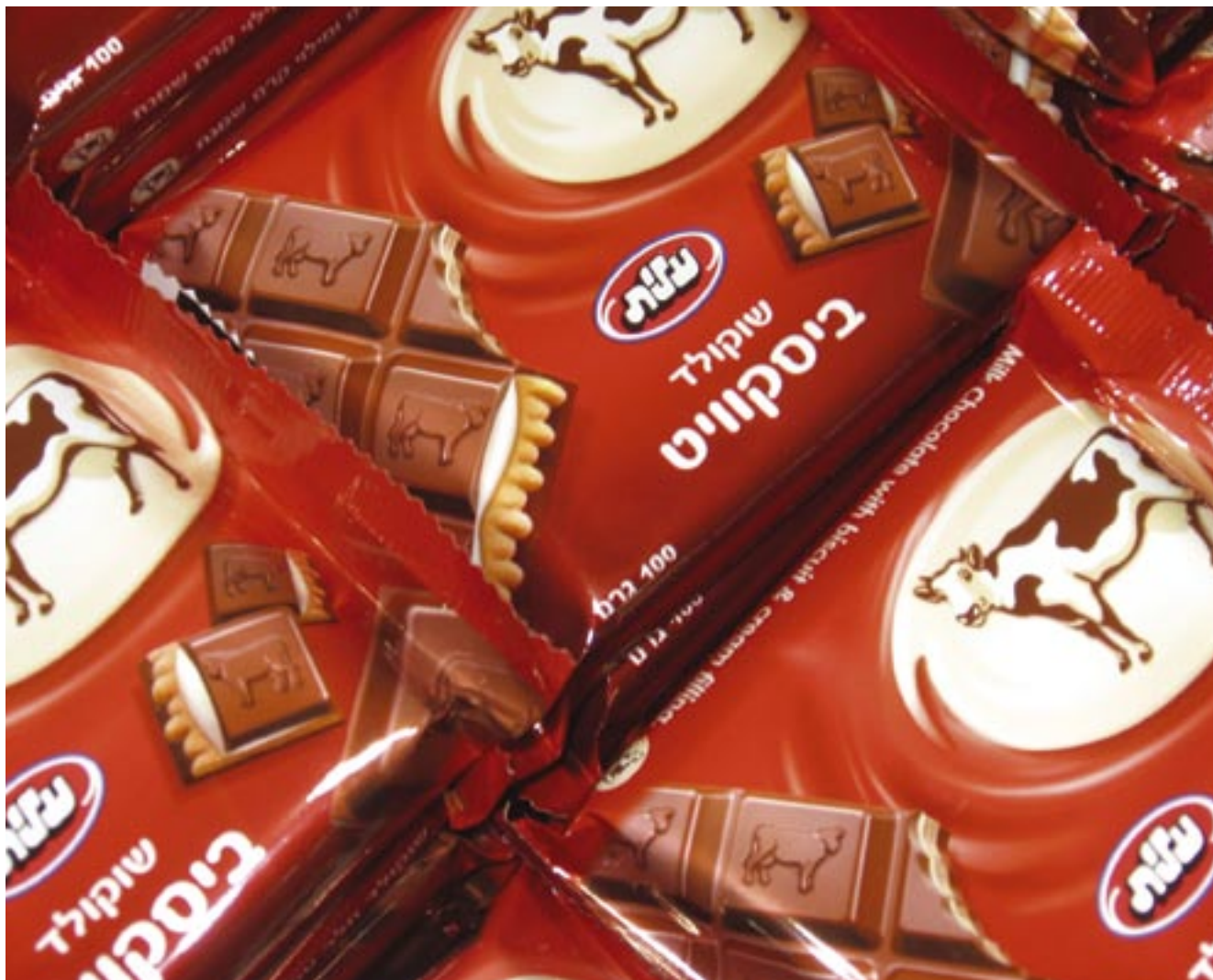
הערה נא • אראל רוזמן / סטודיו