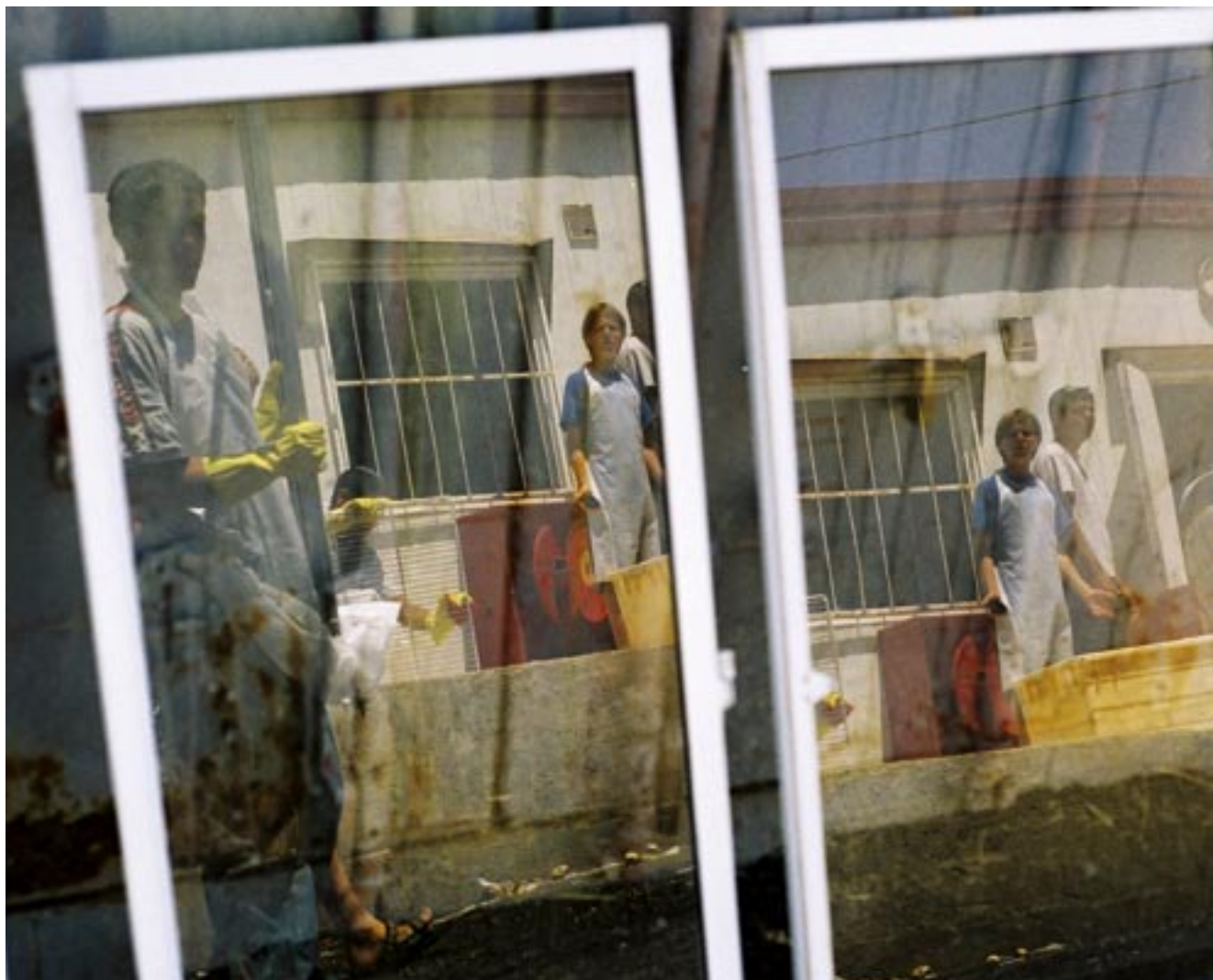
על נטילת ידיים • ניקונות פסח • ספי בר חי / מחזור ה