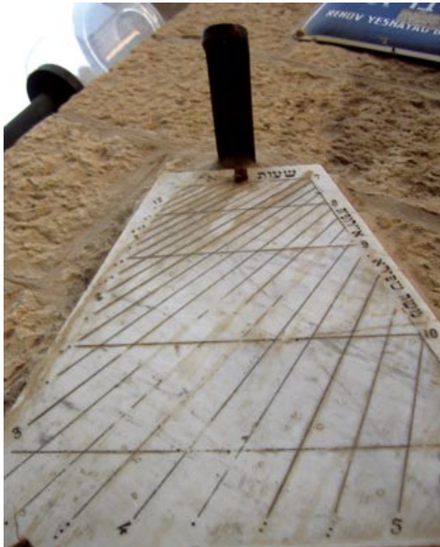
אפילו שעה אחת • שעון השמש בשעה חסד • ספי בר חי / מחזור ה