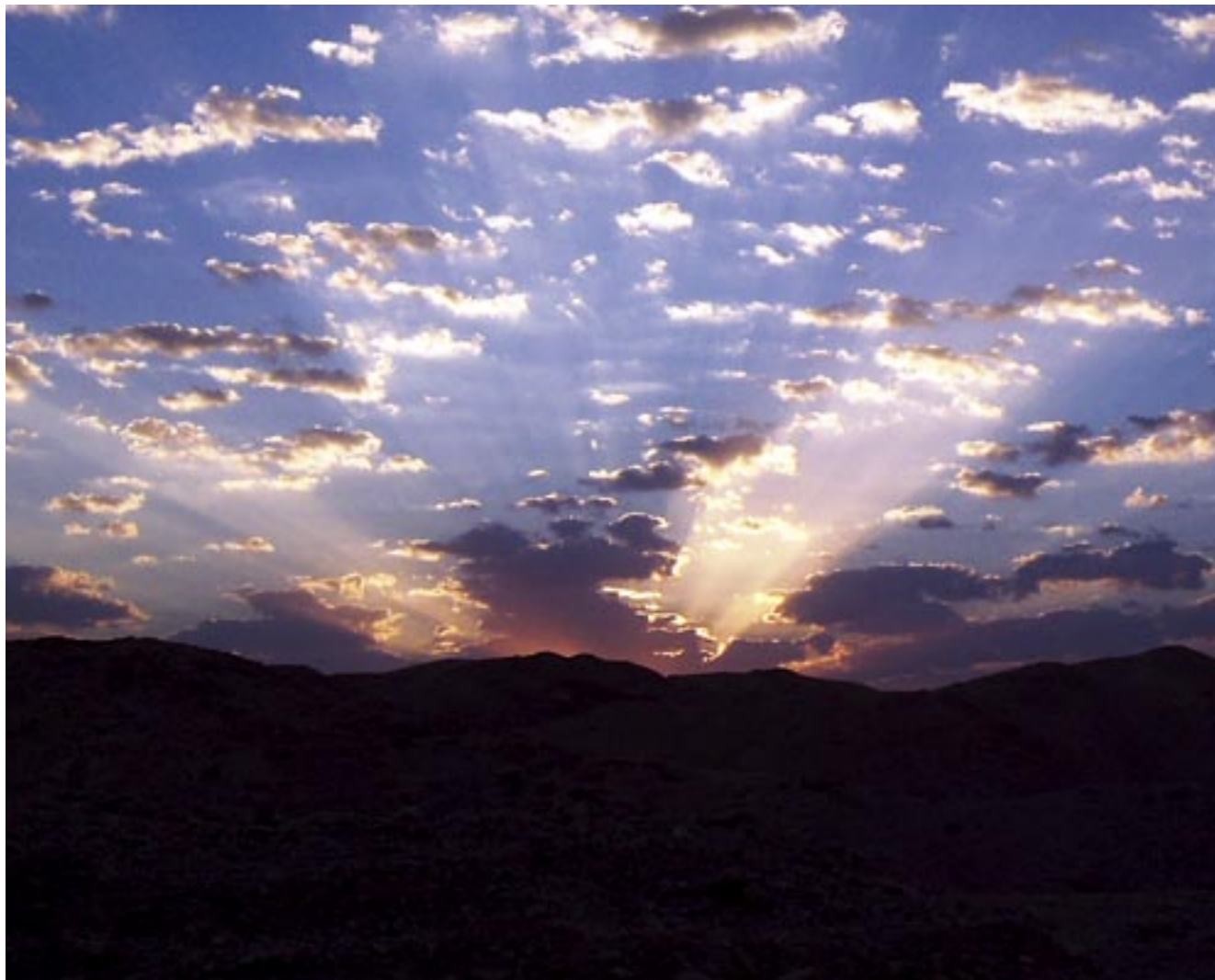
תעשה בבוךך • זריחה בנחל אבוב • רועי חוס / מחזור ז