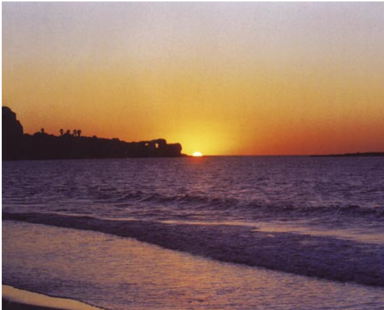
תעשה בן הערביים • חוף עתלית • ינוב בן דוד / מחזור ח