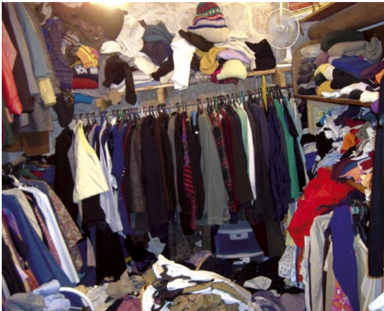
מלביש עדומים • מזכרת משה • רועי הוס / מחזור ז