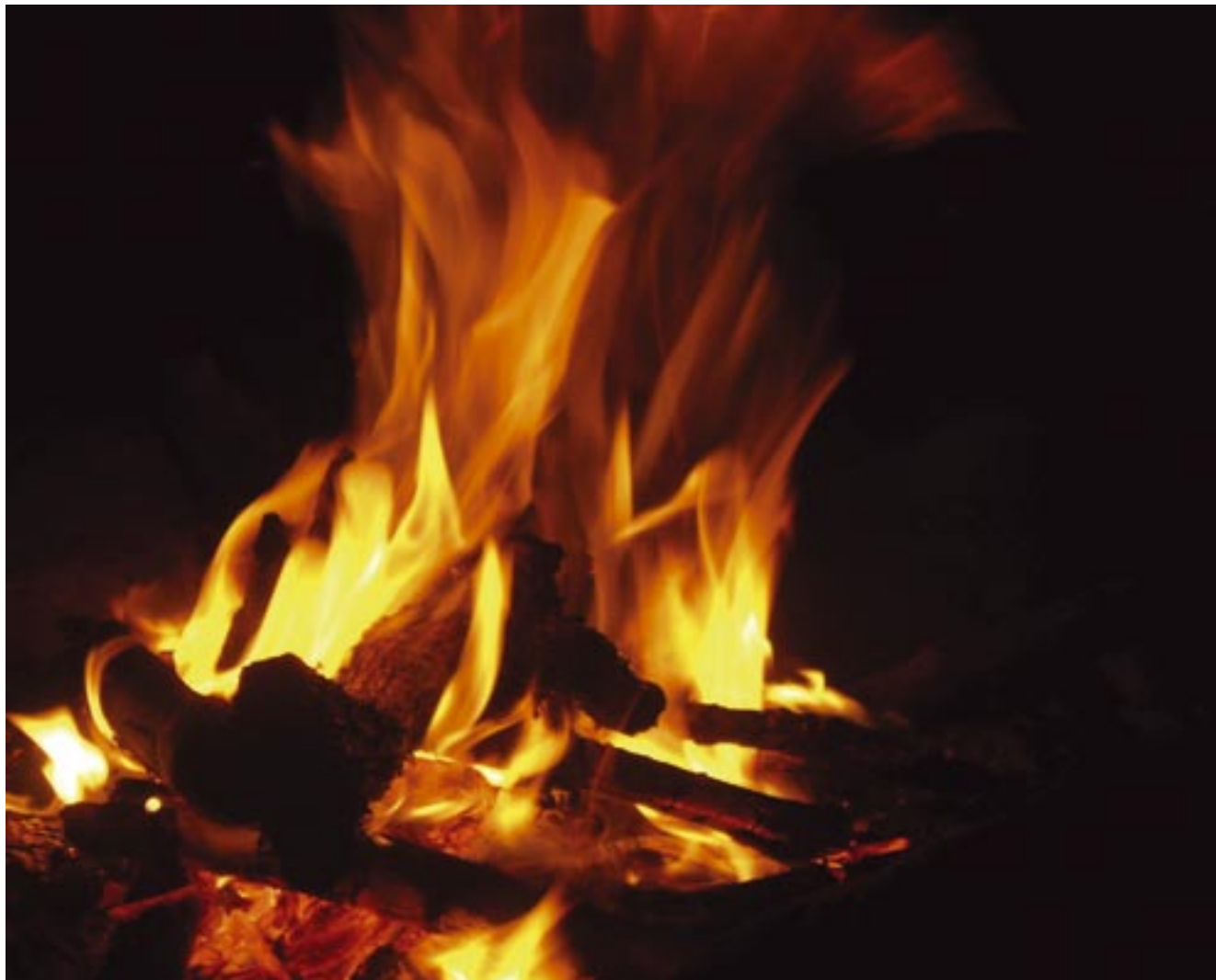
אישה ריח ניחוח • לילה בחצבני • זביר כח