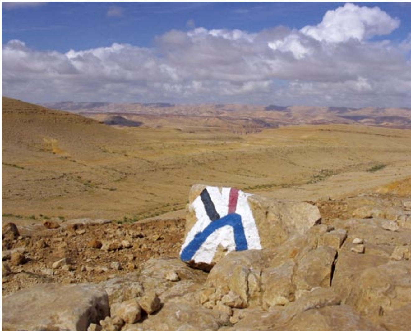
המכין מצעדי גבר • ראש מעלה עקובים הרומי • זורון שר אבי