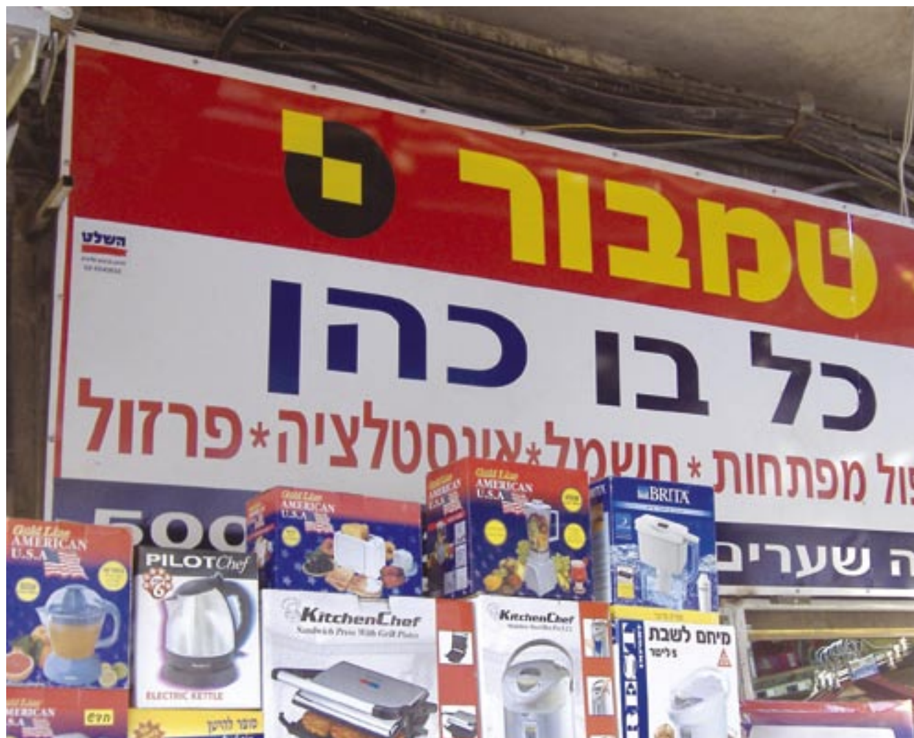
בני אהרון הכהנים • מאה שערים • נעם פרל