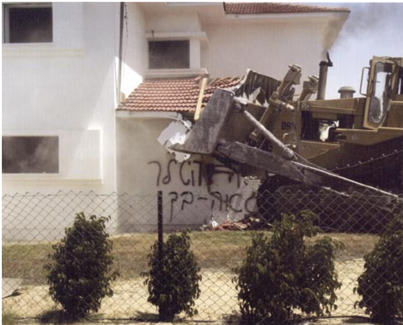
הגותן ליעוף כח • הרס גוש קטיף • מירי צחי ©