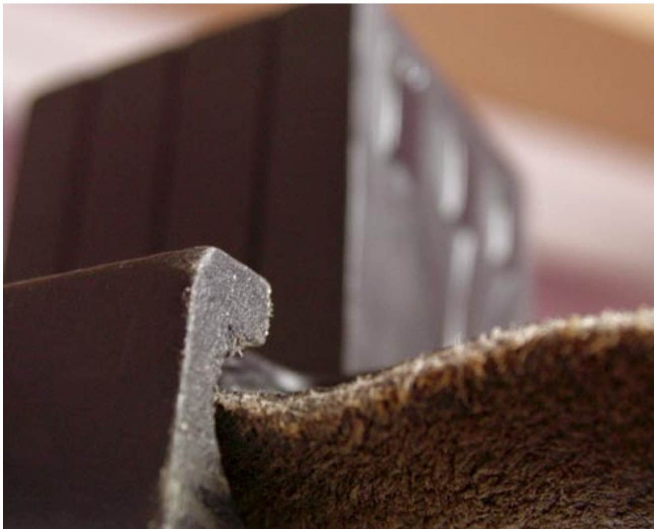
עוטף ישראל בתפארה • תפילין של ראש • ספי בר חי / מחזור ה