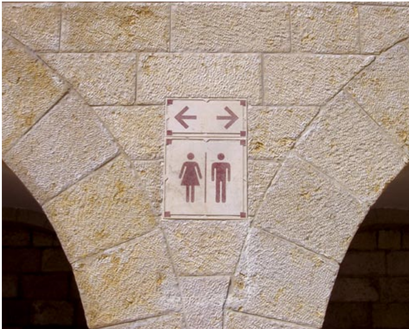
שלל עשני • רחבת הכותל • נעם פרל