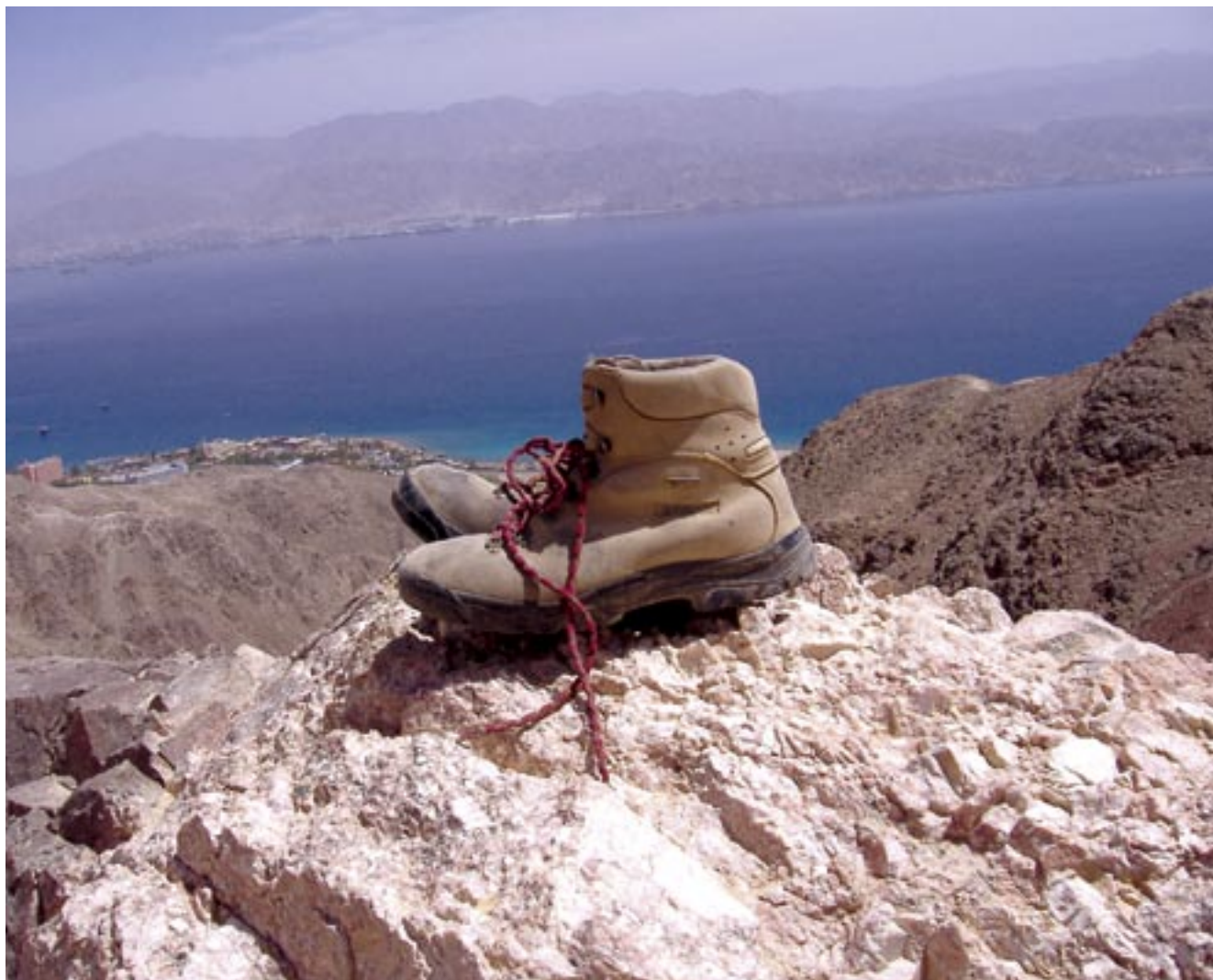
שעשה לי כל צרכי • הר אפחות • אהרון בר חי / מחזור ז