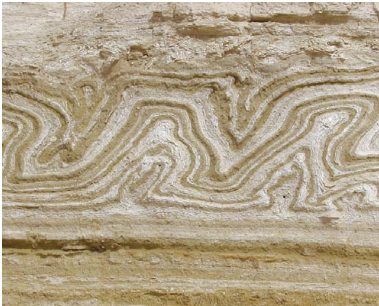
ברוך עושה בראשית • סלעי משקע ימים בהר סזום • סלו ונגרובסקי