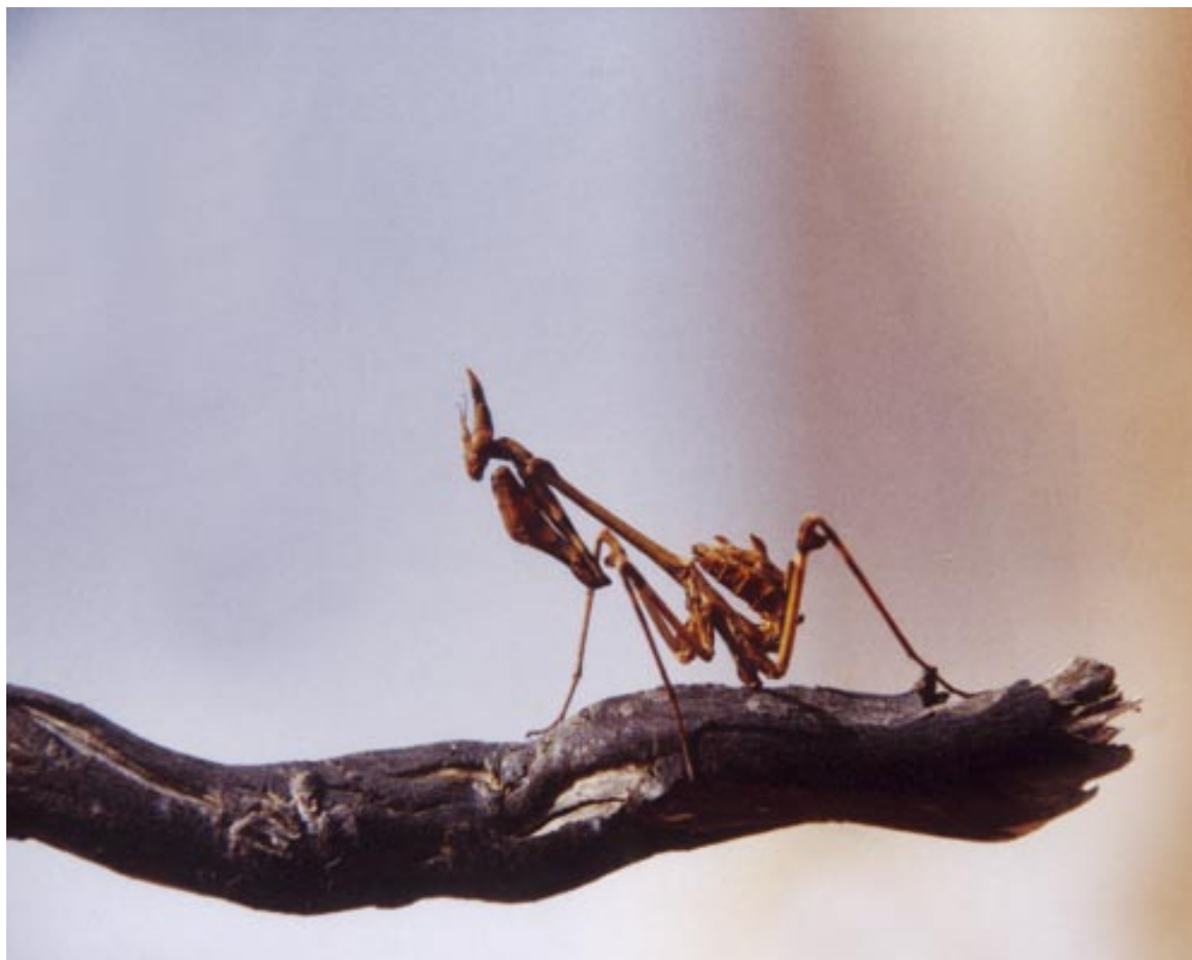
מרחם על הבריות • גמל שלמה • אראל רוזמן / מחזור ד