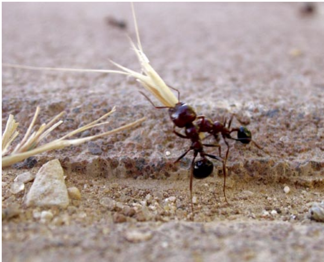
מרחם על הבריות • נמלת קציר • ספי ברי-חי / מחזור ה