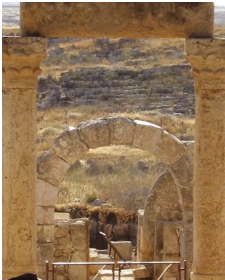
בואו שעזריו • בית הכנסת העתיק בטוסיא • סלו ונגרובסקי