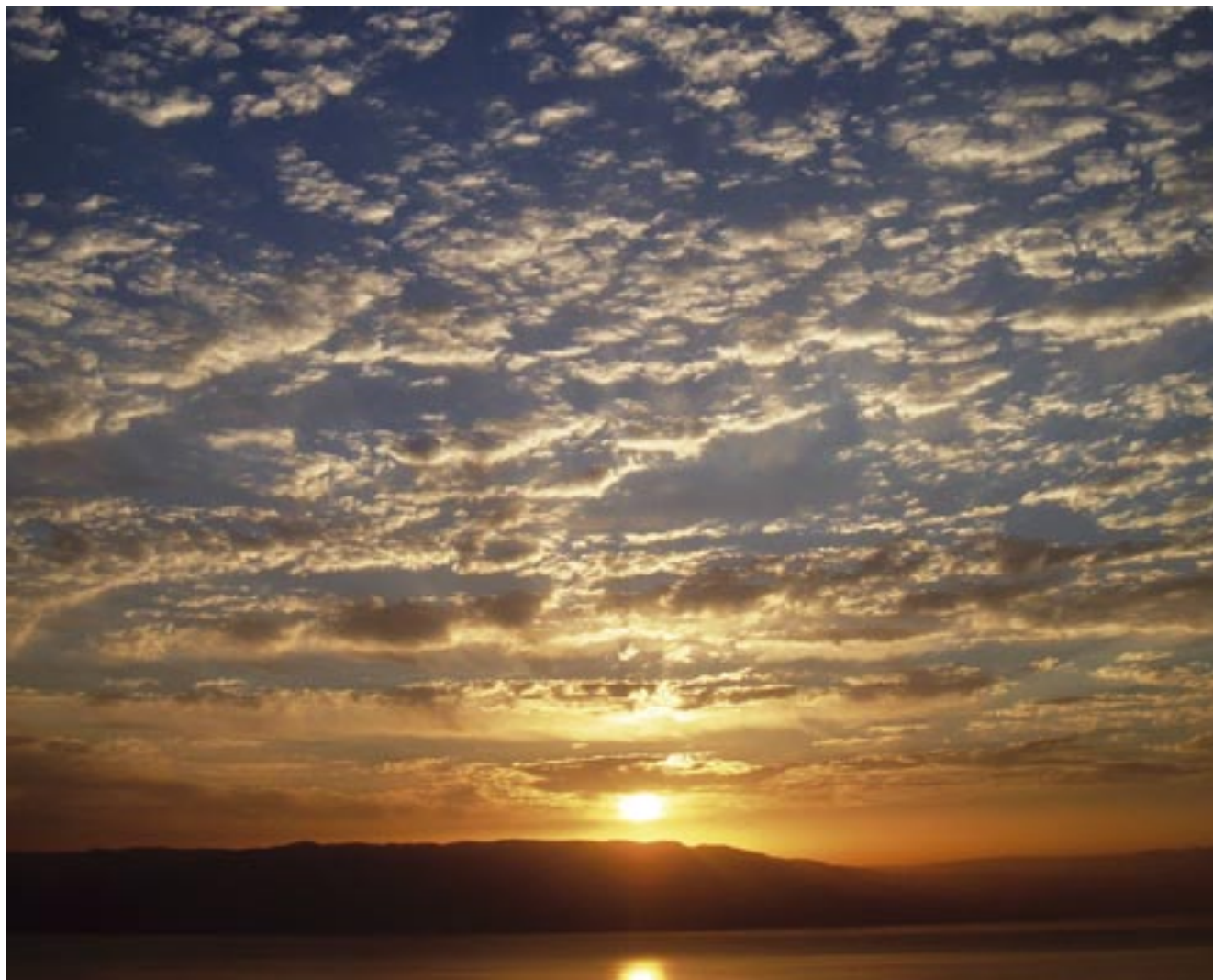
מזרח שמש • נחל רחף • ספי ברי-חי / מחזור ה