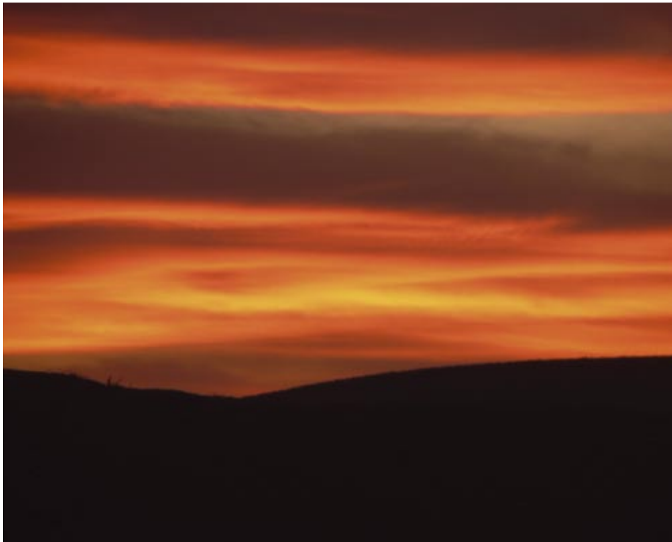
עֵד מְבוּאֵי • שְׂקִיעָה סוּסְיֹאִית • עֵדן הוֹפְפֵן / מְחֻזָּר ז