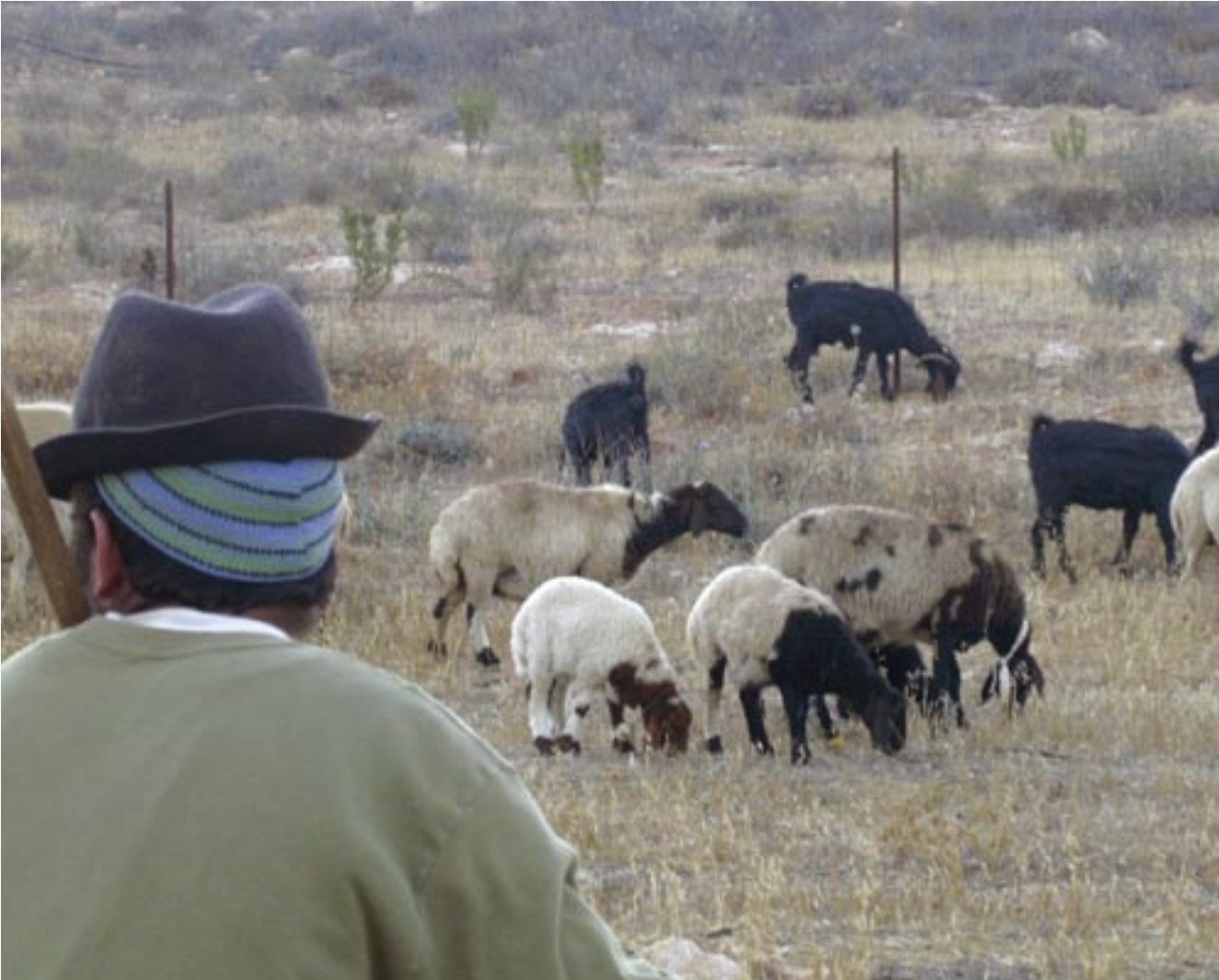
צאן מודיעתני • חושה עברי בהר חברון • ספי בר-חי / מחזור ה