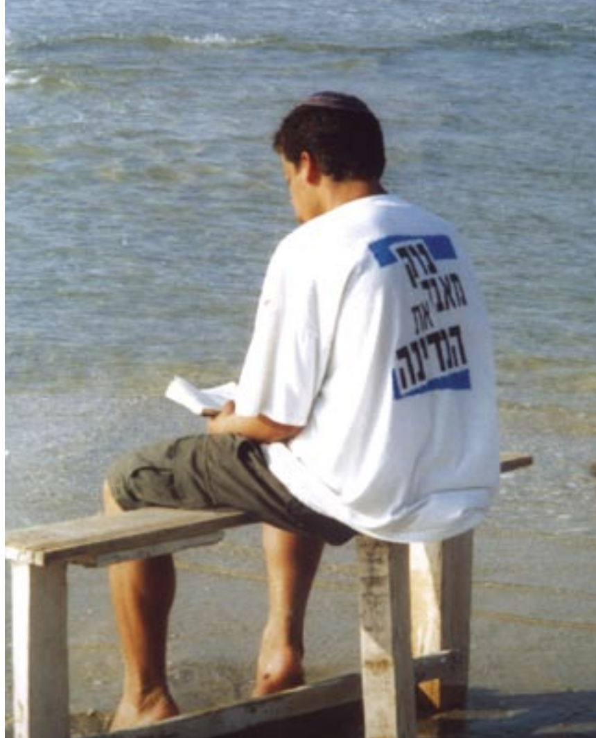
מלך מזולל בתשבחות • שירת הים • עמיתו פרימון / מחזור ה