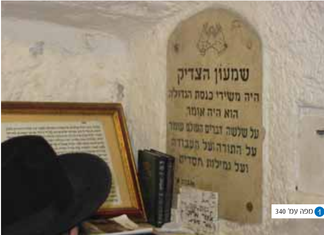
תמצית מורשת שמעון הצדיק: "תורה, עבודה ונחמיות חסדים"

בני אדם שהן מטלין בשוקים על השק ועל האפר לא הגיע לאנטיפטרס עד שבאה לו אגרת שנהרג קסגלס מיד נטל את הצלם ונתנו לישראל וגרוו אותו. ושמעון שמעון קול מבית קדשי הקדשים שהוא אומר בטילת עבידתא לאיתאה להיכלא אתקטיל קסגלס ובטלו גזרותיו וכתבו אותה שעה וכונו ואותו היום עשאוהו יום טוב ". (מגילת תענית הסכוליון ד"ה / עשרים ושנים בשבת).