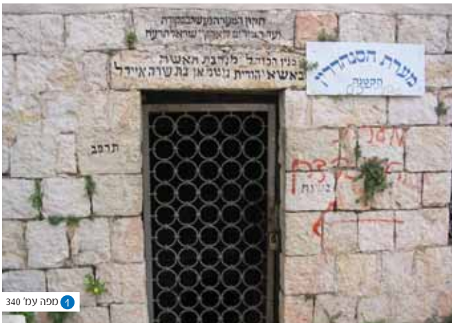
1 ספה עמ' 340

באחרית ימיו חש שמעון באיום ההולך ומתרגש על המקדש, מנסה לעכבו ומציגו בפני בני דורו - "...מעשה ב(כהן גדול) אחד שהאריך (בתפילתו בקדש הקדשים ביום הכיפורים) וגמרו להיכנס אחריו. אמרו שמעון הצדיק היה אמרו לו למה הארכתה אמר להן מתפלל הייתי על מקדש אלהיכם שלא ייחרב אמרו לו אף על פי כן לא היית צריך להאריך. ארבעים שנה שימש שמעון הצדיק את ישראל בכהונה גדולה ובשנה האחרונה אמר להן בשנה הזאת אני מת אמרו לו מהיכן אתה יודע אמר להן כל שנה שנה ושנה שהייתי נכנס לבית קודש הקדשים היה זקן אחד לבוש לבנים ועטוף לבנים נכנס עמי ויוצא עמי ובשנה הזו נכנס עמי ולא יצא עמי" (ירושלמי יומא פ"ה ה"ב).