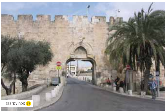
שער האשפות כיום - בלתי ניתן לזיהוי לאחר הסרת בית השער והרחבתו לכדי מעבר אוטובוסים בדרכם אל הכותל.

הגבונית, אלא שמזימתם נחשפת והם יורדים מן הרעיון. מני אז מחלקים הבונים את שעוניהם, כוחותיהם וציודם בין הבניה לחובת האבטחה והשמירה, ומעצבים נהלי אבטחה כפדניים. - "וַיְהִי מִן הַיּוֹם הַהוּא חָצִי נְעָרֵי עֹשִׂים בְּמִלְאכָה וְחָצָיִם מְחַזְקִים וְהַרְמָחִים הַמְגַנְנִים וְהַקְּשָׁתוֹת וְהַשְּׂרִינִים וְהַשָּׂרִים אַחֲרַי כָּל בֵּית יְהוּדָה: הַבּוֹנִים בַּחֹמָה וְהַנְּשָׂאִים בְּסָבֵל עֹמְשִׁים בְּאַחַת יָדוֹ עֹשֶׂה בְּמִלְאכָה וְאַחַת מְחַזְקֵת הַשֶּׁלַח: וְהַבּוֹנִים אִישׁ חֲרָבוֹ אֲסוּרִים עַל מְתָנְיוֹ וּבּוֹנִים וְהַתּוֹקֵעַ בְּשׂוֹפָר אֲצֵלִי: וְאָמַר אֶל הַחֲרִים וְאֶל הַסְּגָנִים וְאֶל יֵתֵר הָעַם הַמְּלַאכָה הַרְבֵּה וְרַחֲבָה וְאַנְחֵנוּ נִפְרָדִים עַל הַחֹמָה רְחוֹקִים אִישׁ מֵאַחֵיו: בְּמָקוֹם אֲשֶׁר תִּשְׁמְעוּ אֶת קוֹל הַשׂוֹפָר שָׁמָּה תִקְבְּצוּ אֵלֵינוּ אֶלְהִינוּ יִלְחָם לָנוּ: וְאַנְחֵנוּ עֹשִׂים בְּמִלְאכָה וְחָצָיִם מְחַזְקִים בְּרָמְחִים מַעְלוֹת הַשְּׁחָר עַד צֵאת הַכּוֹכְבִּים: גַּם בְּעַת הַהִיא אֲמַרְתִּי לָעַם אִישׁ וְנִעְרוּ לֵלֵנוּ בְּתוֹךְ יְרוּשָׁלַם וְהָיוּ לָנוּ הַלֵּילָה מִשְׁמֵר וְהַיּוֹם מְלָאכָה: וְאִין אָנִי וְאָחִי וְנְעָרֵי וְאַנְשֵׁי הַמִּשְׁמֵר אֲשֶׁר אַחֲרַי אִין אֲנַחְנוּ פְּשָׁטִים בְּגִדֵינוּ אִישׁ שֶׁלַח הַמַּיִם" (נחמיה ד).