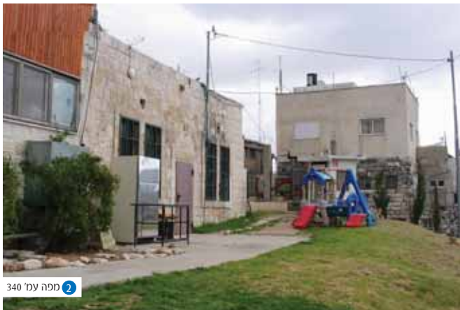
שכונת שמעון הצדיק - שכונה יהודית קטנה וענייה המוקמת בשנת 1891 בסמוך לקבר וניטשת בפרעות תרצ"ז. בסמוך אליה פורצים חיילי הצנחנים לשחרור מזרח העיר. כיום שופצו בתיה ויהודיה חוזרים לבתיהם.

עם פטירתו של שמעון הצדיק מתגלעת מחלוקת ירושה בין בניו בעטיה בורח חונוי הגדול שהיה מיועד לרשת את אחיו, מצרימה, ומיסד בה מזבח ובית מקדש אשר נתקיימו מאות שנים - "בשעת פטירתו, אמר להם: חונוי בני ישמש תחתי... לא קיבל עליו חונוי, שהיה שמעי אחיו גדול ממנו שתי שנים ומחצה, ואף על פי כן נתקנא בו חונוי בשמעי אחיו, אמר לו: בא ואלמדך סדר עבודה, והלבישו באונקלי וחגרו בצילצול והעמידו אצל המזבח. אמר להם לאחיו הכהנים: ראו מה נדר זה וקיים לאהובתו, אותו היום שישתמש בכהונה גדולה אלבוש באונקלי שליכי ואחגור בצילצול שליכי (בגדי נשים). בקשו אחיו הכהנים להרגו, סח להם כל המאורע, בקשו להרוג את חונוי, רץ מפניהם ורצו אחריו, רץ לבית המלך ורצו אחריו, כל הרואה אותו אומר: זה הוא זה הוא, הלך לאלכסנדריא של מצרים ובנה שם מזבח והעלה עליו לשם שמים" (בבלי מנחות קט:).