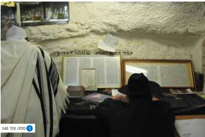
1 ספה ענ' 340

ממרכבתו והשתחוהו לפניו. אמרו לו: מלך גדול כמותך ישתחוהו ליהודי זה? אמר להם: דמות דיוקנו של זה מנצחת לפני בית מלחמתי. - אמר להם: למה באתם? - אמרו: אפשר בית שמתפללים בו עליך ועל מלכותך שלא תחרב יתעוך גויים להחריבו? - אמר להם: מי הללו? - אמרו לו: כותיים הללו שעומדים לפניך. - אמר להם: הרי הם מסורים בידיכם. מיד נקבום בעקביהם ותלאום בזנבי סוסייהם, והיו מגררין אותן על הקוצים ועל הברקנים עד שהגיעו להר גריזים. כיון שהגיעו להר גריזים חרשוהו, וזרעוהו כרשינין" (בבלי יומא ס"ט.). חג שני המופיע ב'מגילת תענית' גם הוא נחוג בעטיו של שמעון הצדיק, ותיפקודו קר הרוח אל מול גזרות היוונים - "בעשרין ותרין בטילת עבידתא דיאמר סנאה לאיתאה להיכלא דילא למספד. מפני ששלח קסגלגס את הצלם להעמידו בהיכל ובאה שמועה לירושלם ערב החג. אמר להם שמעון הצדיק עשו מועדיכם בשמחה שאין דבר מכל הדברים ששמעתם. מי ששכן שכנתו בבית הזה כשם שעשה נסים לאבותינו בכל דור ודור כך יעשה לנו נסים בזמן הזה. וכיון שראה שהיו משמשין ובאין אמר להם צאו וקדמו לפניהם יצאו מלאכים וקדמו לפניהם מלאך אחד לעכו והשני לצור והשלישי לצידן והרביעי לכזיב. וכשנודע הדבר יצאו מלפניו כל גדולי ירושלם אמרו נמות ולא תהא כזאת היו צועקים ומתחננים לשליח. אמר להם השליח עד שאתם צועקים ומתחננים לי צעקו והתחננו לאלהיכם שבשמים כיון שהגיע לכרכין ראה בני אדם ששם מקדימים אותו מכל כרך וכרך כיון שראה אותם היה תמה אמר כמה מרובין אלו. אמרו לו אלו הן היהודים שהקדימו לפניך לכל כרך וכרך נכנס לכרכין וראה את