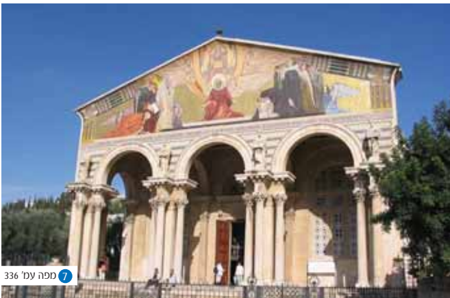
7 מפנה עמ' 336

לא פלא הוא כי גרעין מורשתו של יהושע בן פרחיה עוסק בסמכות הרב, בחברות ובדין כל אדם, גם אם חטא ואכזב, לכף זכות - "יהושע בן פרחיה ונתאי הארבלי קבלו מהם יהושע בן פרחיה אומר עשה לך רב וקנה לך חבר והוי דן את כל האדם לכף זכות" (אבות א, ו).