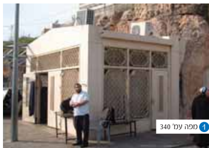
1 ספה עמ' 340

הקמת מקדש חילופי במצרים על ידי בנו - 'מקדש חוני'.