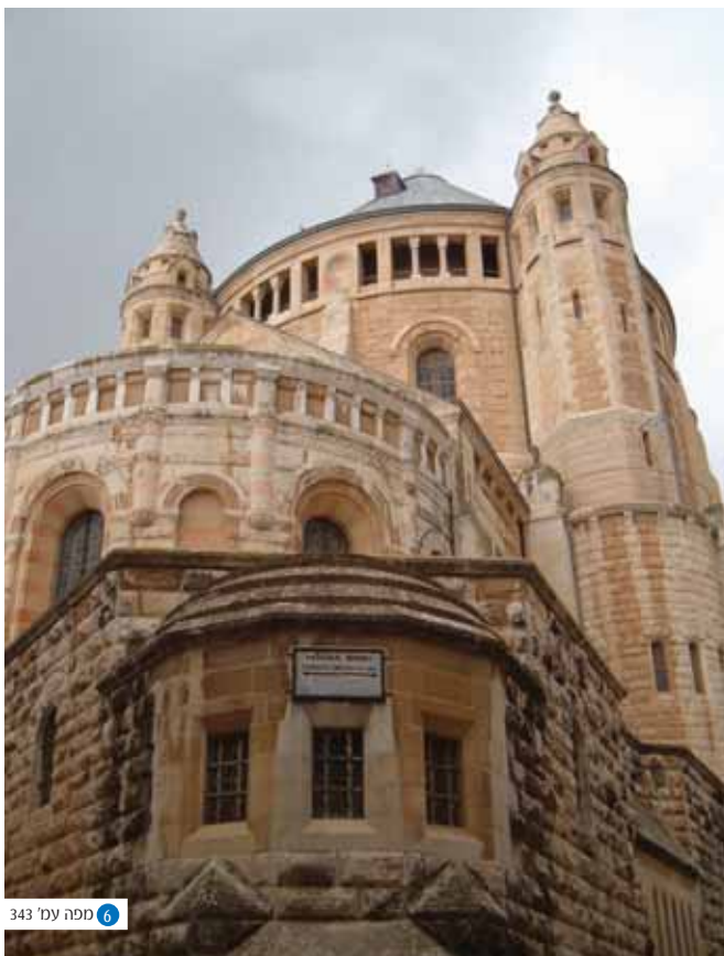
6 מפה עמ' 343

כנסיית הדורמציין - מחירה של טעות חינוכית: פוגרומים, מיסיון, ניצור, אינקוויזיציה, שואה ומעוזי עבודה זרה ביחשלים.