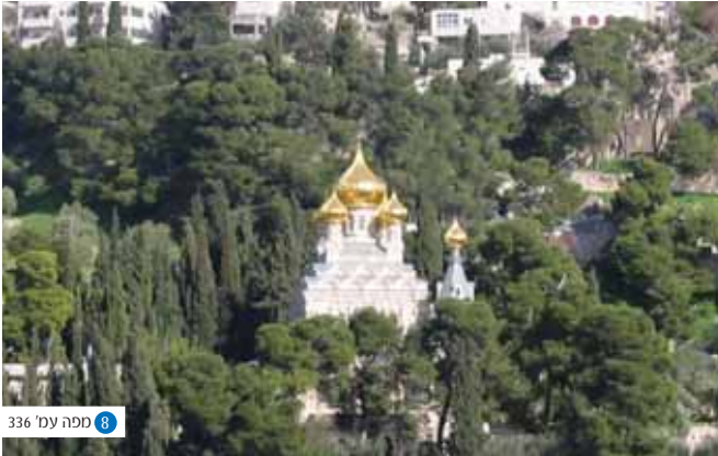
כנסיית מרים המגדלנית - מחירה של טעות חינוכית: פוגרמים, מיסיון, ניצור, אינקויזיציה, שואה ומעוזי עבודה זרה בירושלים.

לאחר שובו מן המקלט באלכסנדריה מוכיח יהושע בן פרחיה בקיאות גדולה בסדרי החיים במצרים, אולם זוכה לביקורת חריפה על העדרותו בימים הקשים אשר עברו על יהדות ארץ ישראל תחת שלטון ינאי ורדיפותיו ומאבד את מעמדו - "יהושע בן פרחיה אומר חטים הבאות מאלכסנדריא טמאו מפני אנטליא שלהן אמרו חכמים אם כן יהיו טמאות ליהושע בן פרחיה וטהורות לכל ישראל" (תוספתא, מכשירין)