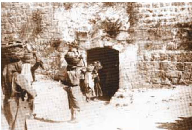
שַׁעַר הָאֲשָׁפֹת הַיְהוּדָאִי עוֹרֵק הַתְּנוּעָה בֵּין הָעִיר הָעִתִּיקָה לְכַכַר סִילוּאָן. בַּמָּאָה ה־19.

לצורך יעול העבודה והצלחת המבצע הכביר מחלק נחמיה את חומת העיר לגזרות, וכל בית אב או יושבי עיר מסוימת אחראים על בניית חלק מוגדר בחומה. עבודה עמלנית וחסרת סכוי זו אינה זוכה ליותר מאשר יחס בזו וזלזול מצד עממי הארץ ומנהיגיהם, סנבלט החורוני, טוביה, העבד העמוני וגשם הערבי.