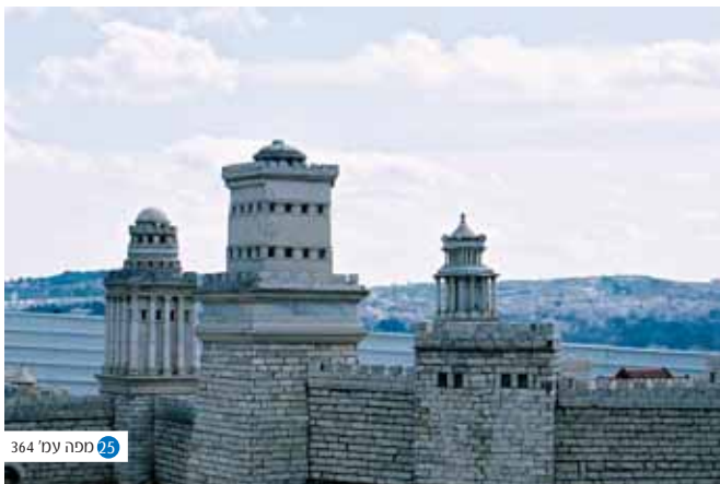
364' מפה עמ' 25

נפש הירא ורך הלבב המתביש בפחדנותו, אך אינו מצליח להתגבר עליה ונאלץ לבצל את ערוץ הפטור ממלחמת הרשות יחד עם מארסי הנשים בוני הבתים ונוטעי הכרמים - "רבן יוחנן בן זכאי אומר בוא וראה כמה חס המקום על כבוד הבריות מפני הירא ורך הלבב כשיהא חוזר יאמרו שמא בית בנה שמא כרם נטע שמא אשה ארש" (מדרש תנאים דברים כ, ח).