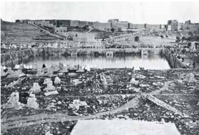
ברכת מטילא - אחת מברכות אגירת המים העוטפות את ירושלים. הברכה שהוזנה כנראה במי אמת המים המגיעה מחר חברון. סיפקה את המים הן לשתיה והן לרחצה.

אף בתחזוקת הגוף וניקיונו חושף הלל עומק רוחני הבא לידי ביטוי אף בנימוסי המלכות הרומית ודרכי התנהלותה - "גומל נפשו איש חסד" - זה הלל הזקן שבשעה שהיה נפטר מתלמידיו היה מהלך והולך עמם. אמרו לו תלמידיו: רבינו, להיכן אתה הולך? אמר להם: לעשות מצוה. אמרו לו: וכי מה מצוה זו? אמר להן: לרחוץ בבית המרחץ. אמרו לו: וכי זו מצוה היא? אמר להם: הן! מה אם איקונין של מלכים שמעמידים אותו בבתי טרטיאות ובבתי קרקסאות מי שנתמנה עליהם הוא מורקן ושוטפן והן מעלין לו מזונות, ולא עוד אלא שהוא מתגדל עם גדולי מלכות. אני שנבראתי בצלם ובדמות ככתוב: 'כי בצלם אלהים עשה את האדם' - על אחת כמה וכמה" (ויקרא רבה לד, ב).