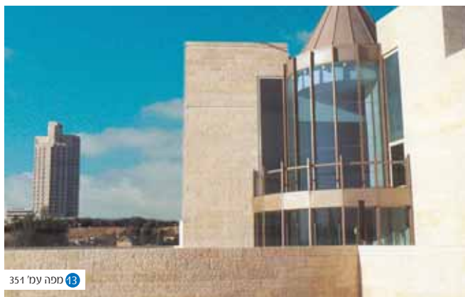
351 מפה עמ' 3

בית המשפט העליון - מעוננו המפואר של בית המשפט העליון ב'קרית הלאום'. בית משפט אשר אינו ממשיך את מורשת המשפט העברית המקורית בה הלך ואותה פיתח שמעון בן שטח, כי אם פונה ל'בורות נשברים אשר לא יכילו המים'.