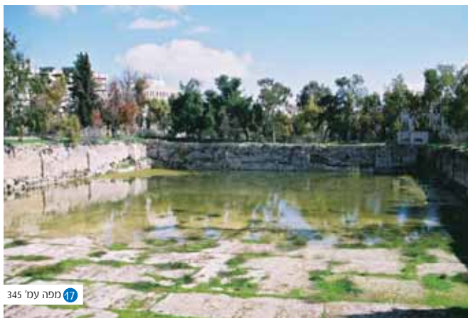
17 מפנה עמ' 345

הלל ושמאי חותמים את 'תקופת הזוגות' בהנהגת העם. מצאצאי הלל בבחרת שושלת הנשיאות אשר תהווה את הנהגתו הרשמית של העם היושב בציון במאות השנים הבאות.