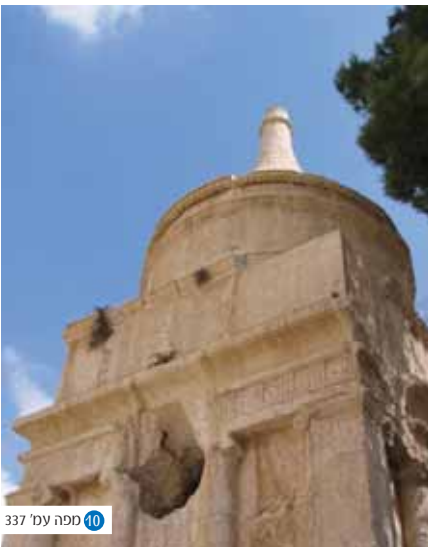
40 מפה עמ' 337

עומד היה שמעון בן שטח על משמר סיוג כח בית הדין לבל יגלוש לתחומים לא לו. אל יטעה הדיין לחשוב כי הכל שפיט תחת ידיו. יזכור כי גבוה מעל גבוה יושב שופט כל הארץ, ובאותם מקרים שאינם מסורים מבחינה טכנית או מהותית להכרעת שום הרכב דיינים הוא אשר יוציא את הצדק לאור. כך עומד הוא ומתריע כנגד ההכרעה על פי ראיות נסיבתיות אפילו אם הן חזקות כצור - "אמר שמעון בן שטח אראה בנחמה אם לא ראיתי אחד שרץ אחר חבירו והסייף בידו נכנס מפניו לחורבה נכנס אחריו ונכנסתי אחריו ומצאתי הרוג והסייף ביד הרוצח ומנטף דם ואמרתיו לו רשע מי הרגו לזה אראה בנחמה אם לא אראנו אני ואתה הרגנוהו אבל מה אעשה לך שאין דינך מסור בידי שהרי אמרה תורה על פי שנים עדים או על פי שלש' עדים יומת המת אלא היודע מחשבות הוא יפרע מאותו האיש לא זז משם עד שהכישו נחש ומת" (משנה תענית ג, ח).