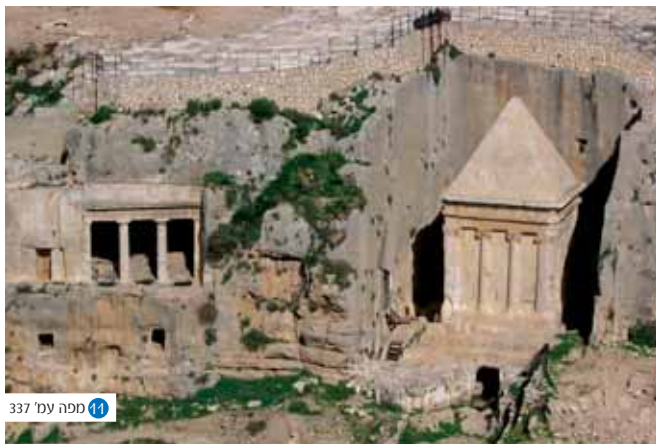
14 ספה עמ' 337

קבר זכריה ובני חזיר - קבר חצוב בסגנון הלניסטי. אותו מיחסת מסורת מהמאה ה-14 לבניא זכריה בן יהוידע. הנרגם למות בחצר המקדש. משמאלו לז קבר הכהנים מבני חזיר בני התקופה החשמונאית בחזיתו הכתובת " זה הקבר והנפש של אלעזר חניה יעזר יהודה שמעון יוחנן בני יוסף בן עובד יוסף ואלעזר בני חניה כהנים מבני חזיר".