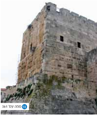
361 ספה עמ' 48

מגדל פצאל - בטיסו של מגדל פצאל, פליט המרידות, הכיבושים ופגעי הטבע, המתנוסס מעל המצודה עד היום.