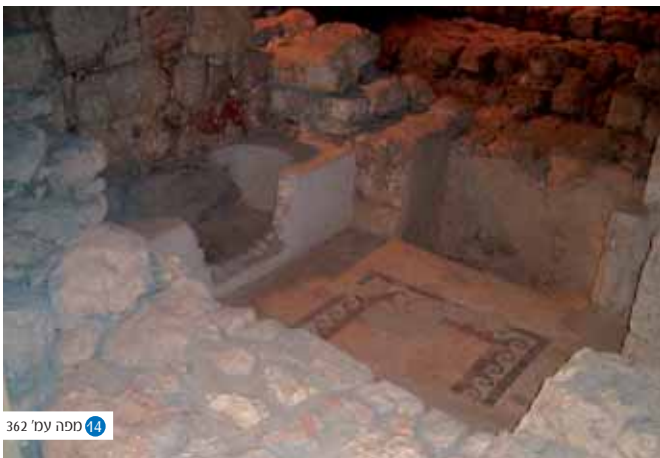
14 מפנה עמ' 362

את הנהגת העם חולק הוא עם שמאי הקפדן, התובעני והנחרץ ההופכי לו במידותיו ודרכי הנהגתו. משתקפת שונות זו ביחסם לשלש בקשות גיור - מוזרות המגיעות אל שולחנם בהזדמנויות שונות, שהמפורסמת שבהן -