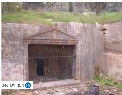
16 מפה עמ' 346

מערות הסנהדרין - מערת קבורה מפוארת מימי בית שני ובה כשיבעים כוכי קבורה. ומכאן זוהיה כמקום קבורת הסנהדרין. המערה נרכשה על ידי יהודים, הפכה למקום תפילה מקודש, ואף זכתה להפיץ על ראשוני שטרות הכסף של מדינת ישראל הצעירה.