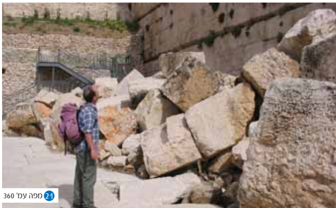
21 ספה ע"כ 360

מפולת אבני החורבן - ערמת אבני הבית השני אשר קרסו אל הרחוב המוצף שתחתן וניפצו את מוצפתיו הענקיות. לגעת בחורבן ללא תיווך. אוי נא לנו כי הושברנו.