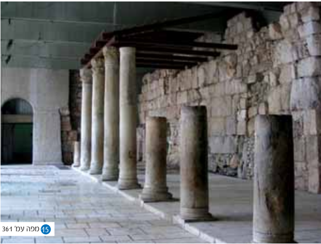
15 סֵפֶה עֵמֶל 361

טרפעיִק - מטבע נחושת בן חצי דינר, שֵכר יום עבודתו של הלל בעוֹנו. מטבע זה כונה גם איסתרֵא. ועליו נאמר הַיֵּב "איסתרֵא בלִינָה קִיש קִיש קִירֵא" המִזְהָה ברעשנות סימפֵטוֹם של רִיקְמוֹת.