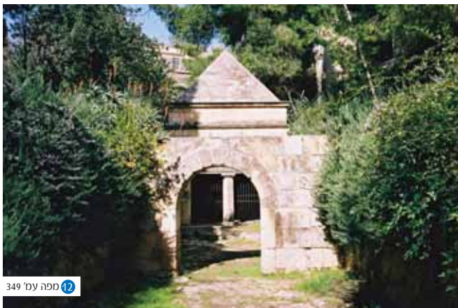
12 ספה עמי' 349